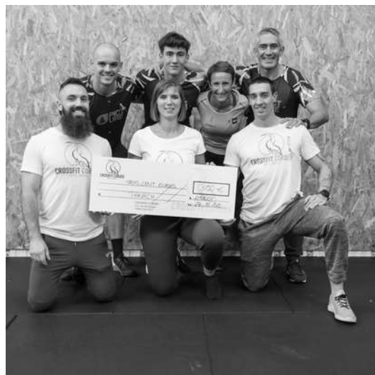
L'équipe Crossfit Cordée et l'équipe PANACH